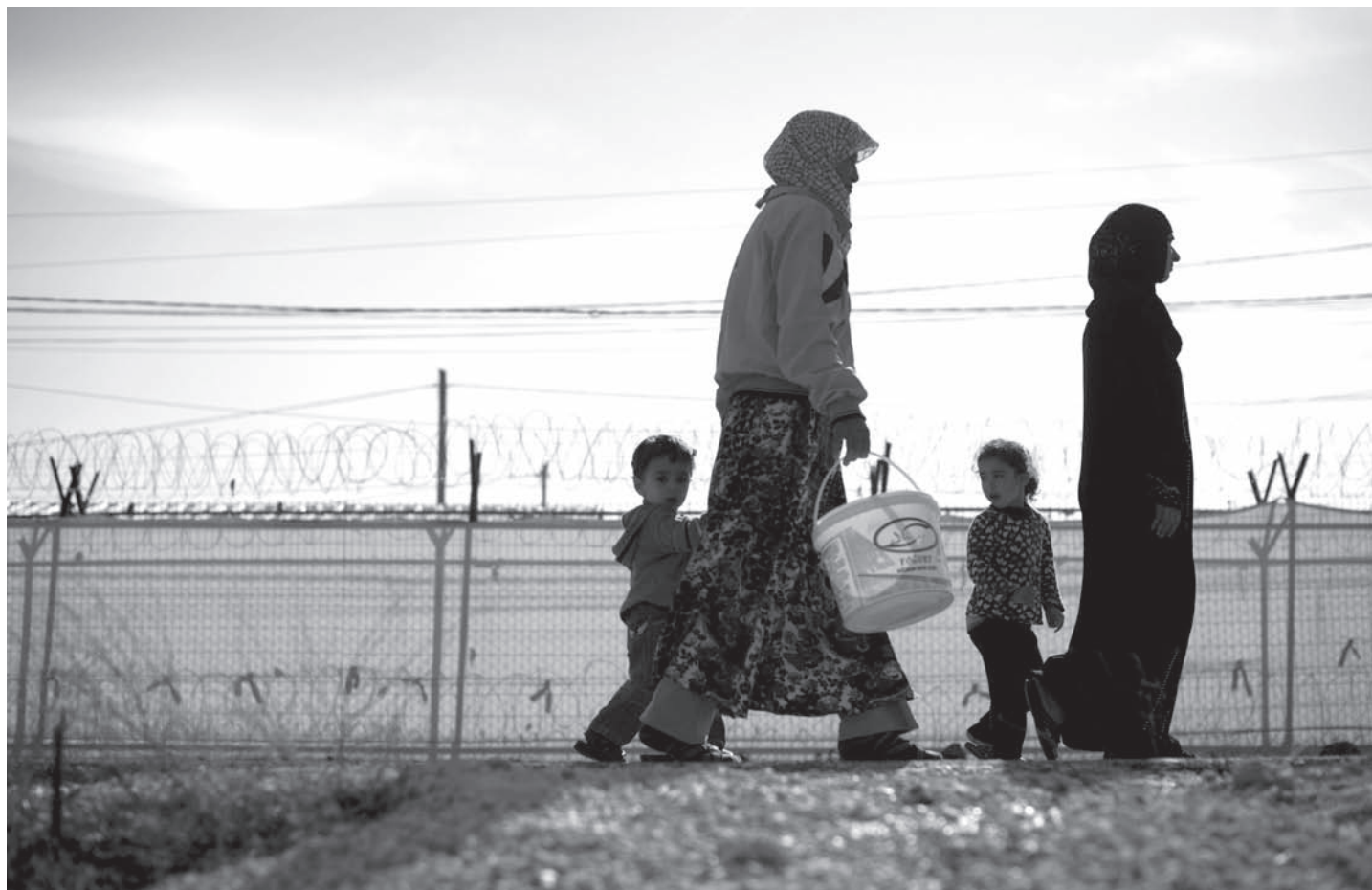
La guerra a Síria està provocant un èxode massiu de població civil.

Amenaçats de mort al Pakistan, on han deixat un fill de 5 anys, van aconseguir arribar fa dos anys a l'aeroport del Prat. Allí mateix van demanar el dret d'asil. Acol·lits a Barcelona per la Creu Roja i assessorats per la Comissió Catalana d'Ajuda al Refugiat, van iniciar, aleshores, la seva particular odisea fins a aconseguir fa pocs mesos l'estatus de refugiats. Un lleu somriure