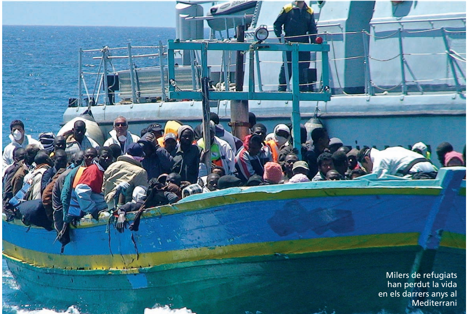
Milers de refugiats han perdut la vida en els darrers anys al Mediterrani

La Comunitat de Sant'Egidio compta amb una llarga trajectòria de diàleg per la pau. Les seves famoses trobades internacionals en són cada any un bon