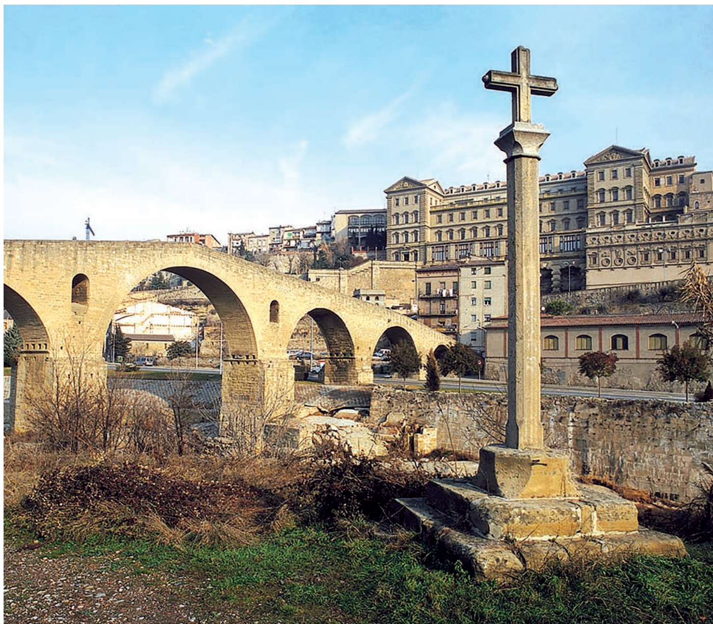
Pont Vell sobre el Cardener a Manresa i al fons el Centre Internacional d'Espiritualitat dels jesuïtes. / Cova Manresa

Setmanari d'informació i de cultura religiosa ANY XLI | NÚM. 2110 2,90 € | 1 MARÇ 2020