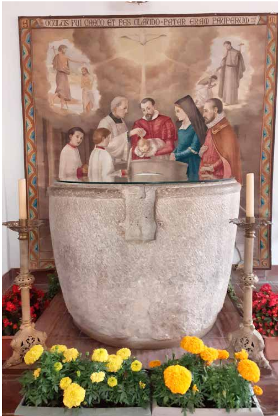
Tapis baptisme Sant Pere Claver, pintat l'any 1953 per Antonio Arribas S.J.

Publicació regular. 1 Número l'any. Tiratge: 500 exemplars. Suplement de la Companyia de Jesús. Subscripció gratuïta. Dip. Legal: L-1354-2003