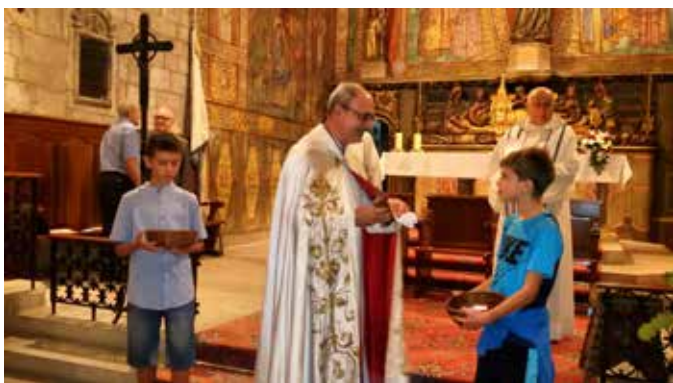
Veneració de la relíquia.