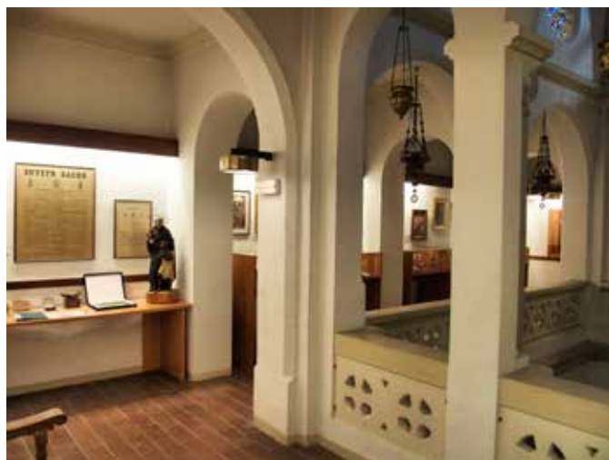
Museu únic al món dedicat exclusivament a la vida i obra de Sant Pere Claver, Santuari de Verdú.