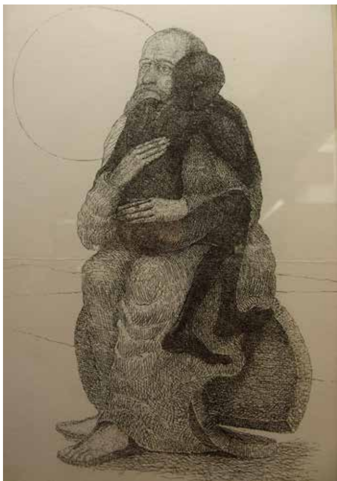
Guillermo Bellod, Còpia gravat 119/125 . Es troba en el llibre "Colegio Santo Domingo" Oriola. Ala sala de consulta de l'arxiu Històric. S.I., Catalunya