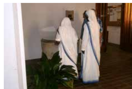
Fotografies de visitants que han passat pel santuari