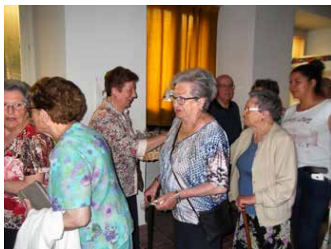
26 juny. bateig del Sant. Repartint els confits