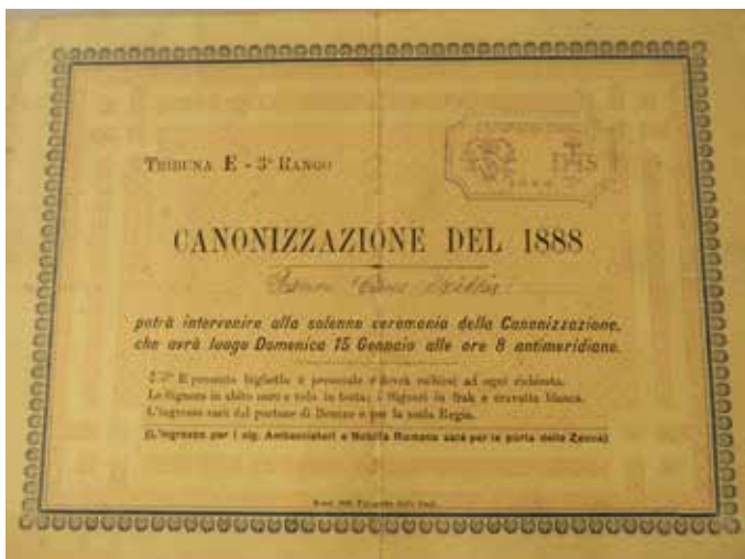
Invitació per assistir a l'acte de canonització de Sant pere claver a favor del delegat de l'ajuntament de Verdú Ramón Cases Millàs.