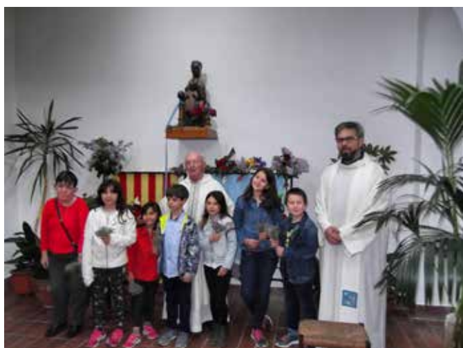
27 abril. Festa de la Verge de Montserrat