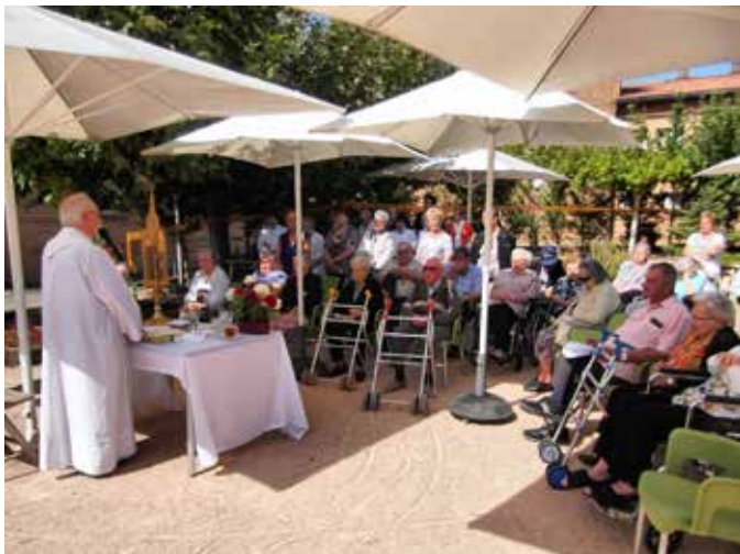
Sant Pere Claver (7-9-17)