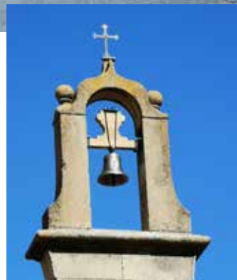
La campana fou col·locada al campanar el 26-9-19

L'església es va obrir el dia 26 de juny per fer la tradicional celebració de l'aniversari bateig de Sant Pere Claver.