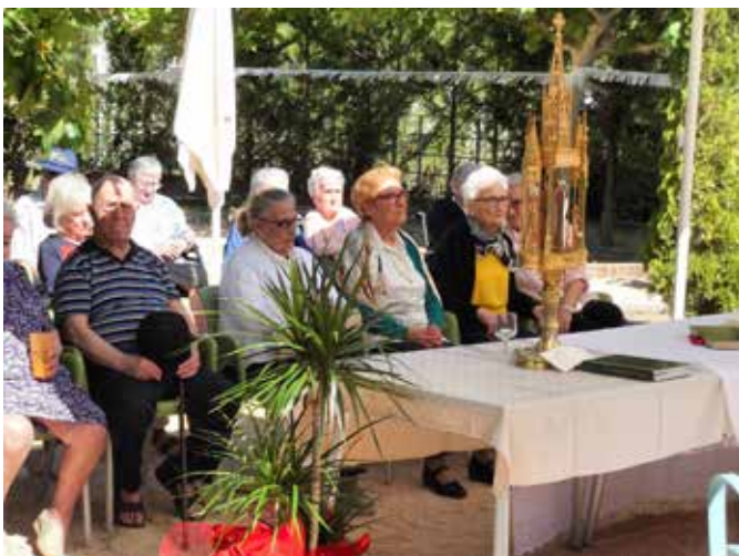
Fotos: Festa major Residència Sant Pere Claver, 5 setembre 2019