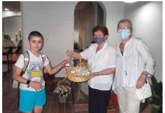
Aniversari bateig de St. Pere Claver