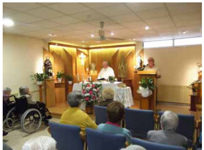
Fotos: Festa Major Residència Mare Marcelina, dia 7 setembre 2019