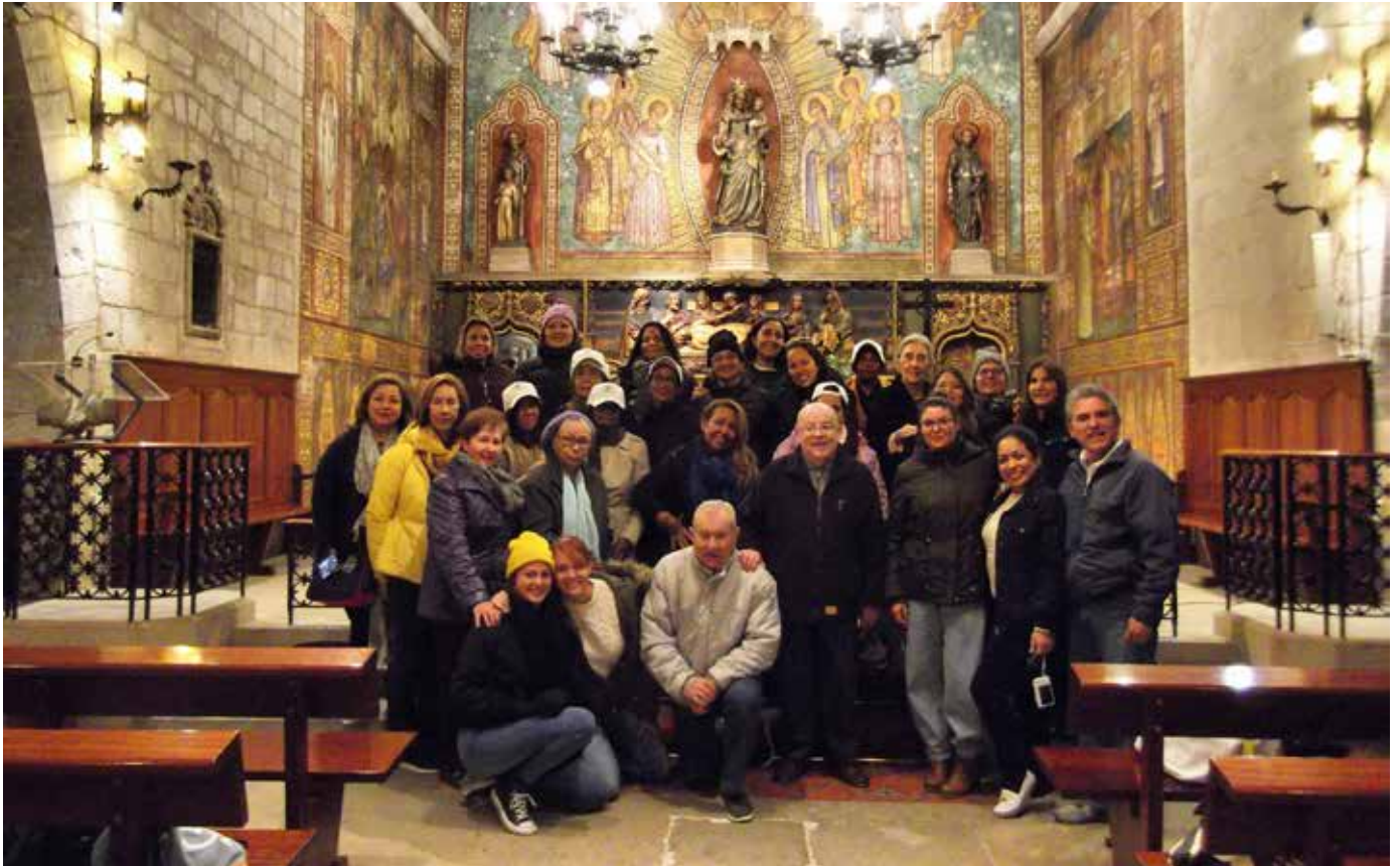
Grup de pelegrins de la parròquia de Sant Pedro Claver de Cartagena d'Índies