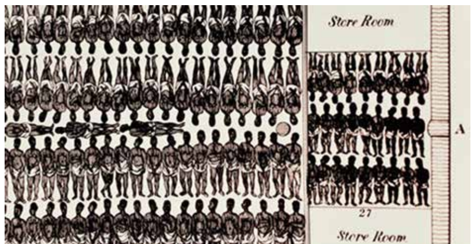
Il·lustració dels esclaus confinats en el seu viatge a Cartagena d'Índies. Font: www.history.com