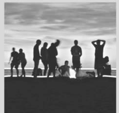
(B. González Buelta)

¡Señor de mis profundidades abismales e ignoradas! Como el primer día de la Creación, búscame y libérame Donde soy tiniebla y engaño, Ordéname con tu Espíritu donde soy caos originario