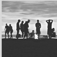
(B. González Buelta)

Nos recatas del lodo con tu mano, nos podas las hojas maltratadas, nos limpias con agua bautismal y nos injertas en el árbol de la vida. Tu abrazo recorre toda mi espalda, y es perdón sin condiciones .